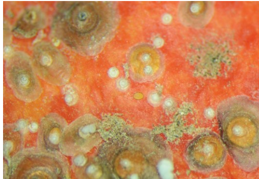
כנימה אדומה (צילום: ד"ר רועי כספי)

כנימות ממוגנות – כנימה אדומה - יש לבצע ניטור קפדני על החנטים החל מהמחצית השנייה של חודש אפריל וכאשר מבחינים בנוכחות של זחלנים או כיפות לבנות על החנטים יש לרסס. ריסוס מאוחר יותר לא יהיה יעיל. יש לתאם את מועד הריסוס עם הפקחים. במידה ויש צורך לרסס מידי שנה צריך לרסס בתכשירים שונים לסירוגין. טייגר, קוברא וטריגון בקבוצה אחת בריכוז 0.1% בנפח תרסיס 300-400 ליטר לדונם, או מובנטו בריכוז של 0.09%, או שמן קיצי בריכוז 2% בנפח גבוה במיוחד