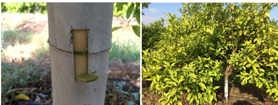
פגיעה בעצה כתוצאה מחיגור גזע חזק מידי

בעצים בוגרים מנטיעת 2015 והלאה נבצע חיגור גזע. בעצים צעירים יחסית מנטיעת 2016 והלאה נבצע חיגור שני ב 80% מהזרועות. יש חשיבות רבה בביצוע ע"י אנשים מיומנים. בעצים צעירים הקליפה דקה ויש להזהר מחיגור חזק מידי שיחדור לעצה ויפגע בהגלדה. בעצים מבוגרים בעלי קליפה עבה הבעיה הפוכה, יש לבדוק שהחיגור חתך את כל הקליפה והגיע עד העצה, יש לבדוק היטב את החיגורים